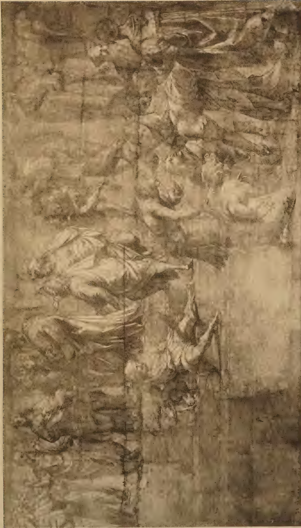
Etude pour l'Ecole d'Athènes